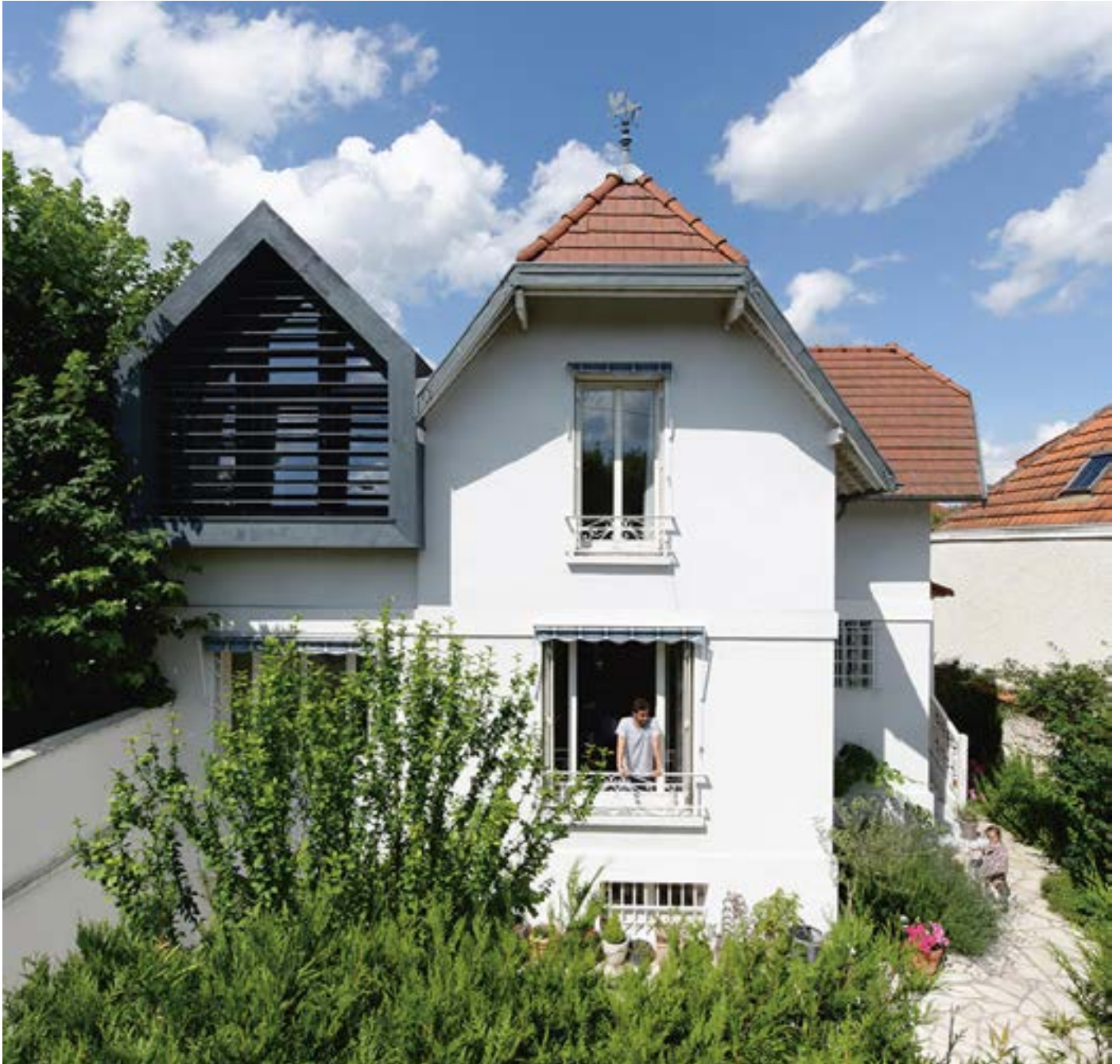
surélévation partielle - THE Architecte - Saint-Maur-des-Fossés (94) - 2012